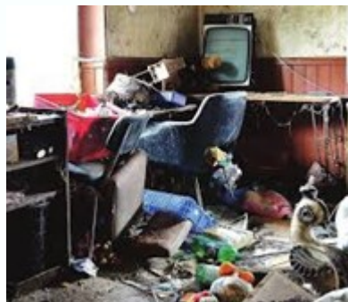
DIHAL, agir face aux situations d'incurie dans le logement, Octobre 2013